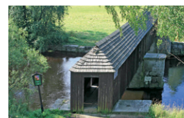
Dřevěný most v Lenoře