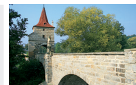
Renesanční most ve Stříbře