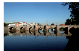
Gotický most v Písku

Všechny mince cyklu „Mosty České republiky“ jsou vyrobeny ze zlata o ryzosti 999.9. Jejich hmotnost činí 1/2 trojské unce, tj. 15,55 gramů, a jejich průměr je 28 mm. Mince se vydávají ve dvojitým provedení ražby – v běžné kvalitě, u které je celá plocha mince stejně leštěna, a ve špičkové kvalitě s leštěným mincovním polem a matovaným reliéfem.