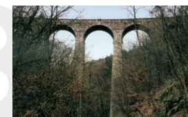
Železniční most v Žampachu