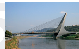
Mariánský most v Ústí nad Labem