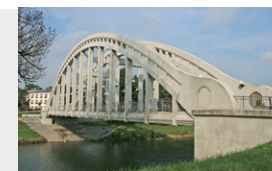
Železobetonový most v Karviné-Darkově